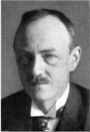
Edvard Bull d.e. 1881-1932 politiker, historiker, Utenriksminister, Nestformann i Ap

”Vi skal gjøre skolen verdslig, likesom sykepleien og begravelser og ekteskapet og fødselsregistreringen.