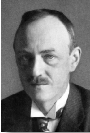
Edvard Bull d.e. 1881-1932 politiker, historiker, Utenriksminister, Nestformann i Ap